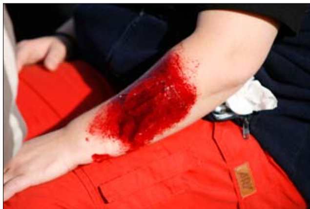
Deltagerne fikk litt å bryne seg på! Røde Kors markørene var godt sminket!