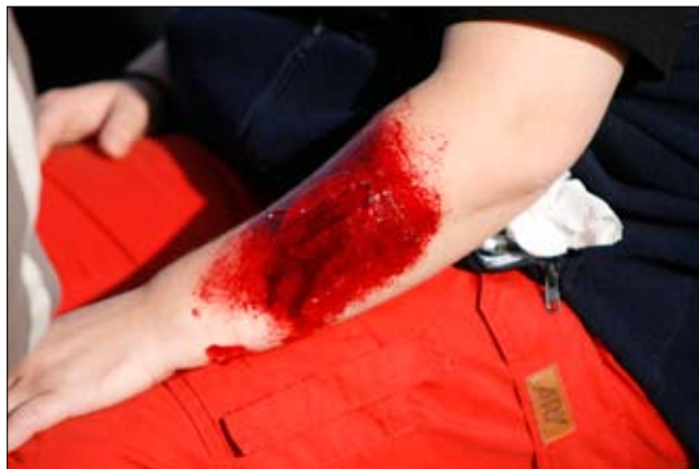
Deltagerne fikk litt å bryne seg på! Røde Kors markørene var godt sminket!