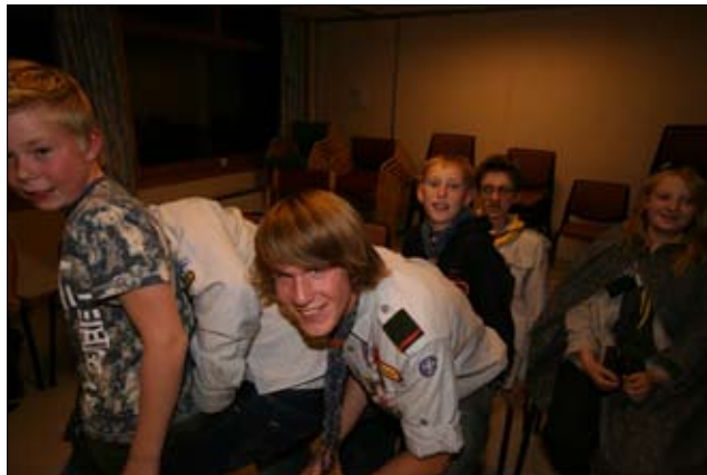
Det var mye moro også under pefftreffet på Solløkka!

Se også www.ms-speider.no for flere bilder fra treffet!