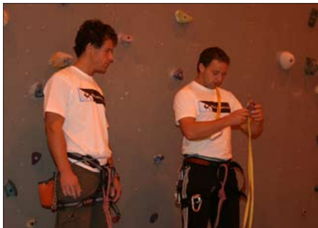
Det var brødrene Lommetjernbakken som hadde klatrekurset.